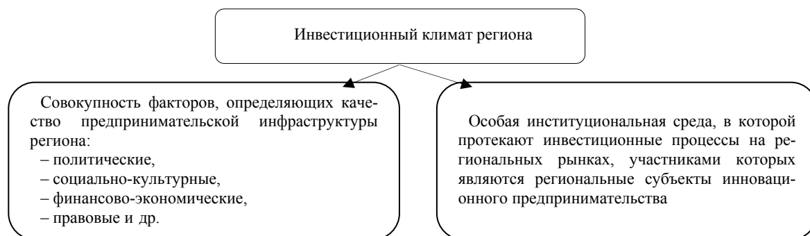
Рис. 1. Инвестиционный климат региона (авторская редакция)

Понятие «инвестиционный климат» по-разному трактуется в научной и учебной литературе (рис. 1).