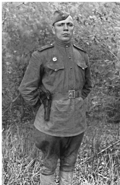
На солнечной поляночке...