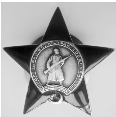
Орден Красной Звезды, спасший моему деду жизнь

позднего вечера работала моя бабушка до седьмого пота вместе с другими женщинами, так же, как и она, сгоняемыми на принудительную работу. Работа была очень тяжелой, есть было нечего и с каждым днем сил оставалось все меньше, но несмотря на это бабушка и многие такие же простые деревенские женщины выдержали это тяжелое и страшное испытание.