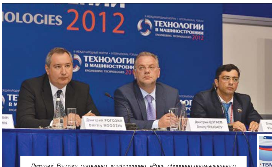
Дмитрий Rogozin открывает конференцию «Роль оборонно-промышленного комплекса в модернизации страны и общества»

Разрешение на демонстрацию боевого оружия требует долгих по времени согласований, и мы использовали для демонстрации имитацию, так называемую игрушку – пейнтбольное ружье, стреляющее шариками, в сопровождении видеопрезентации боевого оружия. Наша «ТРОПА» смотрелась эффектно, и по сравнению с демонстрациями коллег из других вузов даже выигрывало.