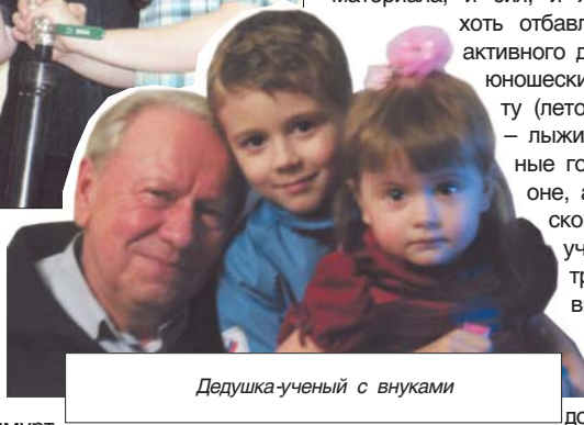
Дедушка-ученый с внуками

Демонтаж деформированных плит перекрытия представлял особую опасность, т. к. при обследовании было выявлено, что арматура сильно повреждена коррозией и не несет ответственности проектной документации (по