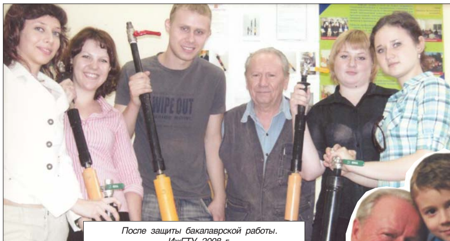
После защиты бакалаврской работы. ИжГТУ 2008 г.